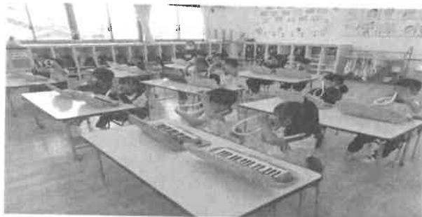
初めての音楽教室の様子です！ メロディオンとタンバリンを習いました♪