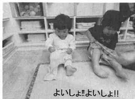
よいしょ!!よいしょ!!