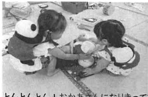
とんとんとん！おかあさんになりきっています！